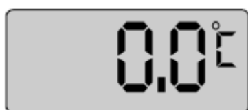
Offset nepromjenjen 00.0

Napomena: Ako offset-vrijednost nije 00.0 tada u mjernom modu na prikazanom znaku za celzijus "C" jedan segment ne će biti prikazan: