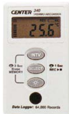
Data-logger za temperaturu sa displayom