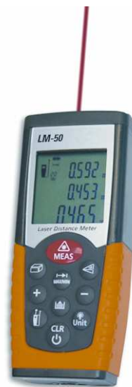
Mjerač udaljenosti za područje 0,05 do 50 m