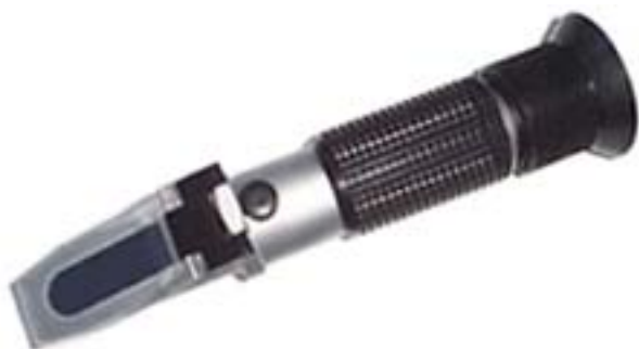
Mjerač količine soli / Refraktometar RHS-28ATC

Ovim uređajem možete brzo i točno izmjeriti količinu soli i specifičnu težinu. Refraktometar RHS-28ATC koristi se za mjerenje slane/morske vode i svih vrsta koncentriranih solnih otopina, na primjer u prehrambenoj industriji.