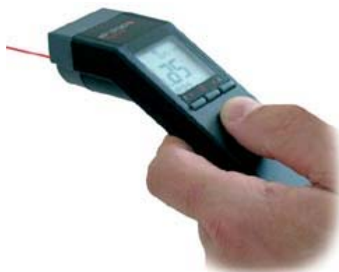
Ručni pirometar MS-PLUS